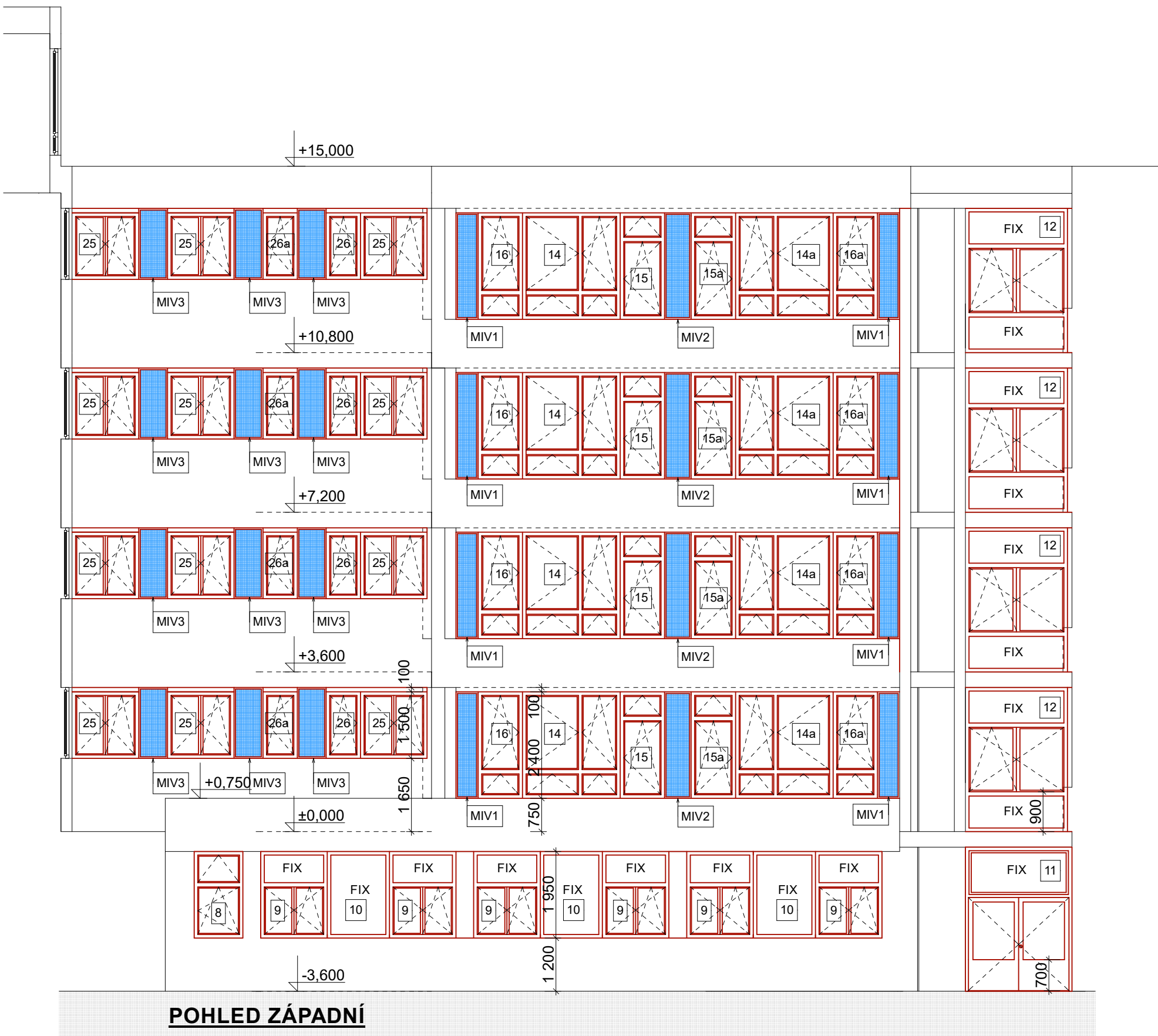
POHLED ZÁPADNÍ NOVÝ STAV